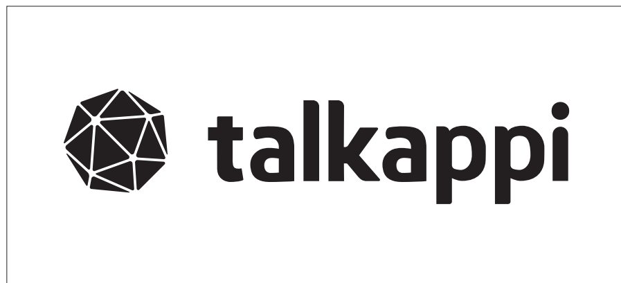
モノクロ (ブラック)